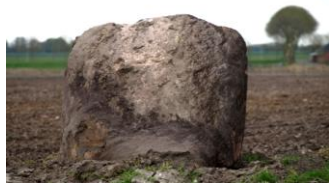
Deze zwerfkeien zijn in de ijstijd vanaf Scandinavië door het landijs hier naar toegedrukt.

Reiderwolde maakt deel uit van de Ecologische Hoofd Structuur (EHS). Dit is het stelsel van natuurgebieden verspreid over Nederland dat d.m.v. verbindingzones zo veel mogelijk aan elkaar gekoppeld wordt, zodat flora en fauna zich kan verplaatsen door heel Nederland. Reiderwolde is aan de zuidkant verbonden met de robuuste ecologische verbindingzone richting Duitsland. Aan de noordkant heeft Reiderwolde een ecologische verbinding met het natuurgebied De Tjamme van Staatsbosbeheer. De boeren van Reiderwolde willen een zo gevarieerd mogelijk landschap creëren: bossen, struweelranden, kruidenrijke graslanden, moerassen, rietlanden, rijen knotwilgen, ouderwetse hoogstamfruitbomen, kikkerpoelen en oeverwaluwanden. De graslanden van Reiderwolde worden beheerd volgens de "verschralingmethode". Dit betekent dat het grasgewas zo veel mogelijk wordt afgevoerd. Hierdoor verarmt de bodem waardoor allerlei bloemen en kruiden de concurrentie met het gras beter aan kunnen (dotterbloemhooiland). In de lage, natte delen vestigen zich moeras-, riet- en watervogels zoals de roerdomp, de rietzanger en de aalscholver. In de graslanden komen o.a. de patrijs, de Kievit en de scholekster voor. 's Winters worden de graslanden massaal bezocht door ganzen.